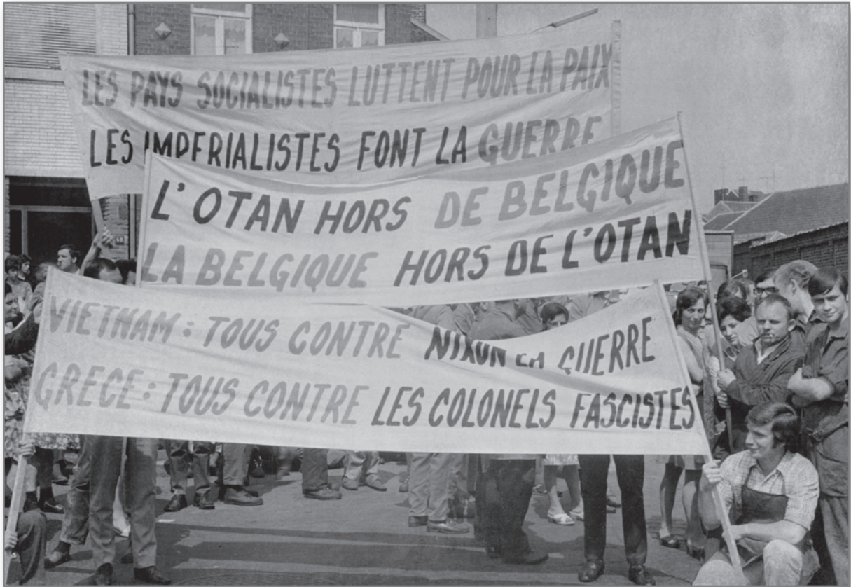
Photographie d'une manifestation, Fabrique nationale d'armes de guerre à Herstal, 1967.